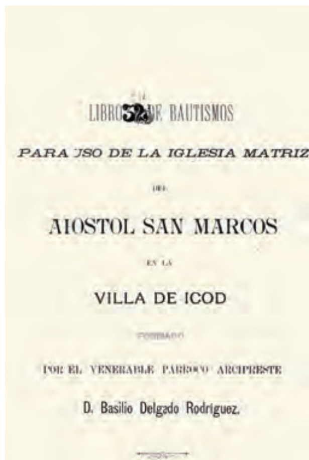
Portada de uno de los libros del Archivo Parroquial

Ello propició su frecuente actuación en los diferentes actos que, con motivo de las citadas festividades, tenían lugar en Icod. Concretamente, el 28 de Septiembre de 1891, en el acto del reparto de premios a los niños de las escuelas: "Fue a no dudarlo el acto más brillante de las fiestas y el más que honra a la Comisión que las ha organizado, puesto que el público icodense ha presenciado por primera vez un espectáculo conmovedor y que demuestra la verdadera cultura, adelanto y progreso. Cuando apareció por la calle de San Sebastián la procesión infantil, formada por niños de ambos sexos, alumnos de las cinco escuelas que cuenta esta Villa, que en correcta formación marchaban