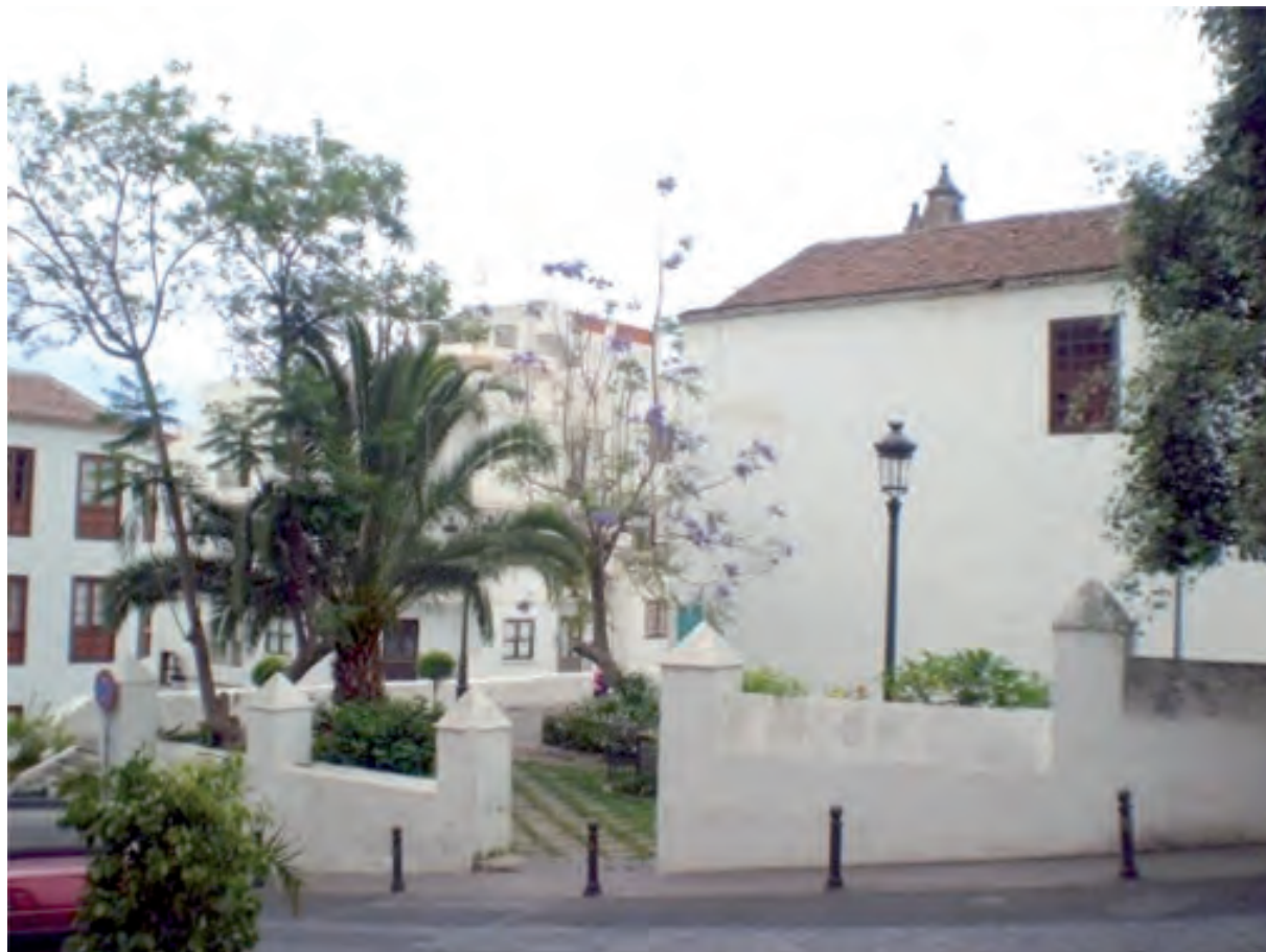
Lateral de la iglesia de San Francisco en Icod de los Vinos