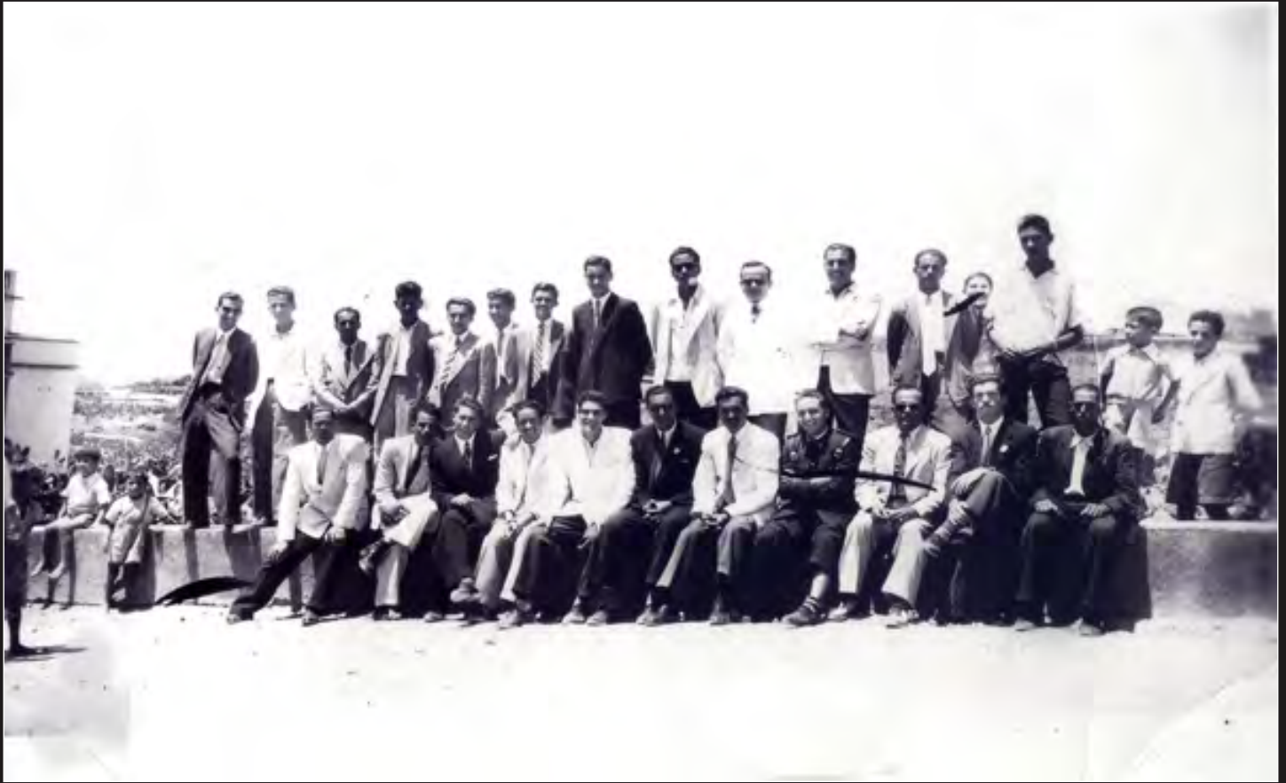
San Miguel, año 1948