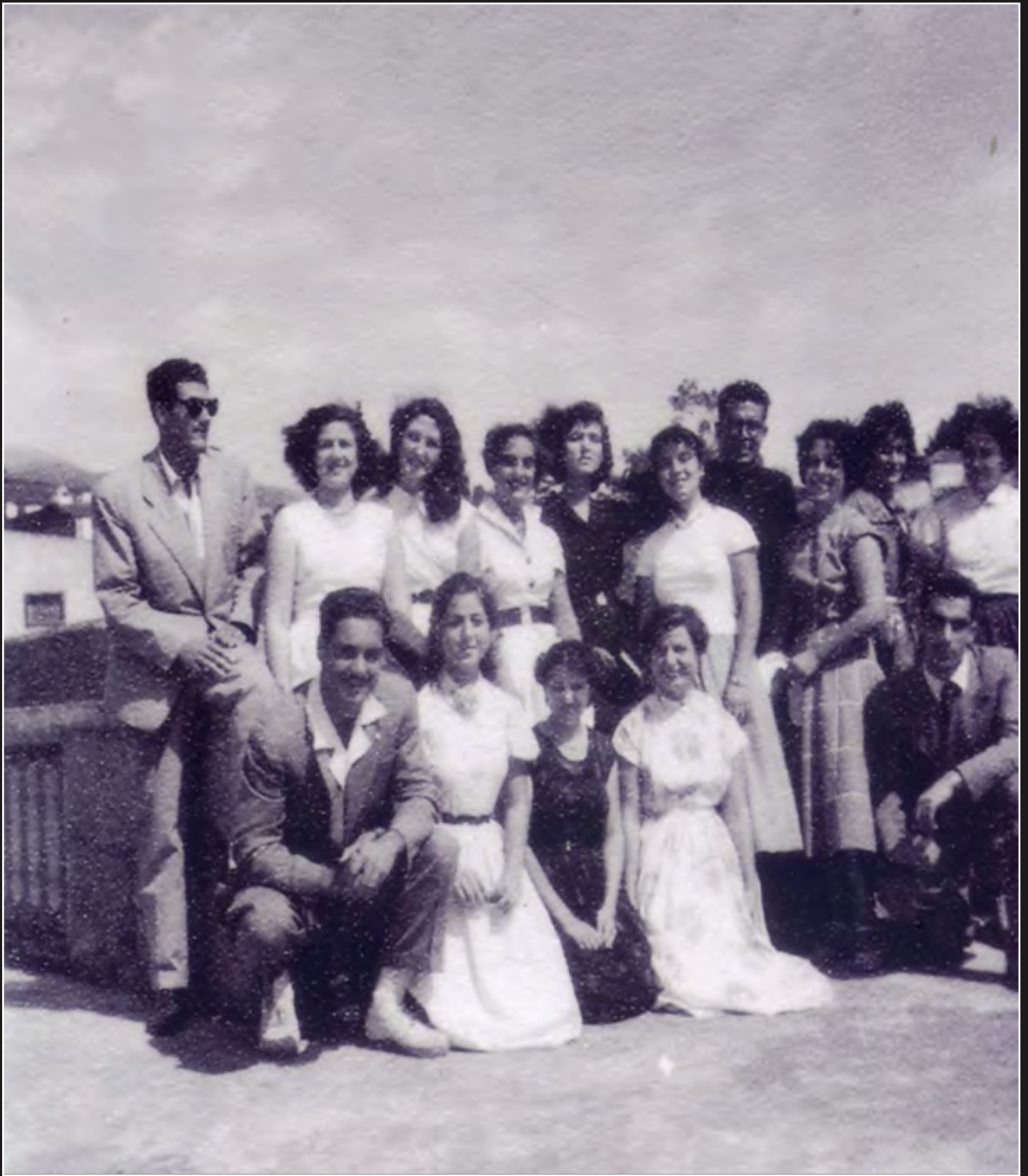
En la Arrotea del Esino San Miguel, año 1952