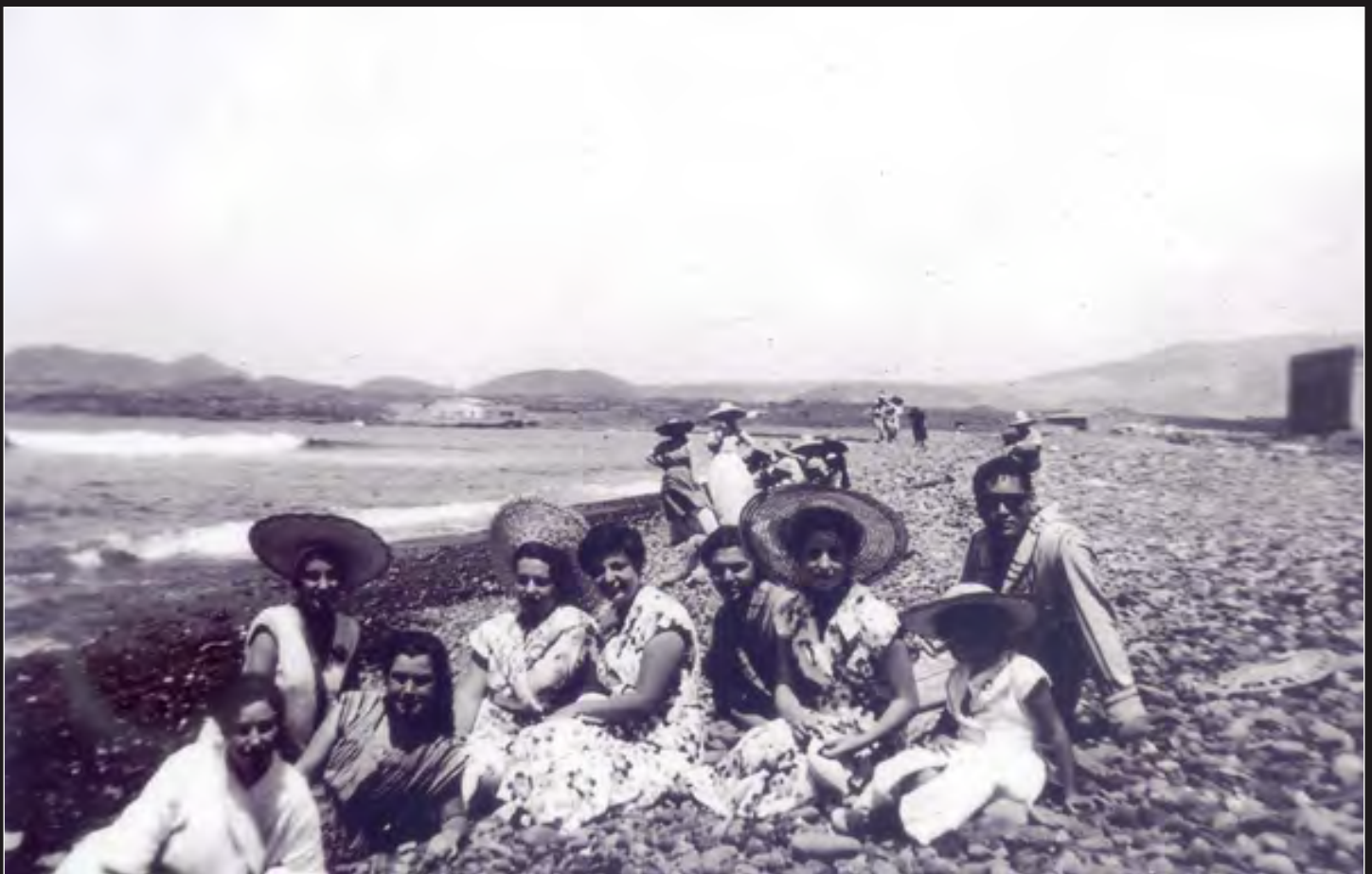
Las Galletas año 1952