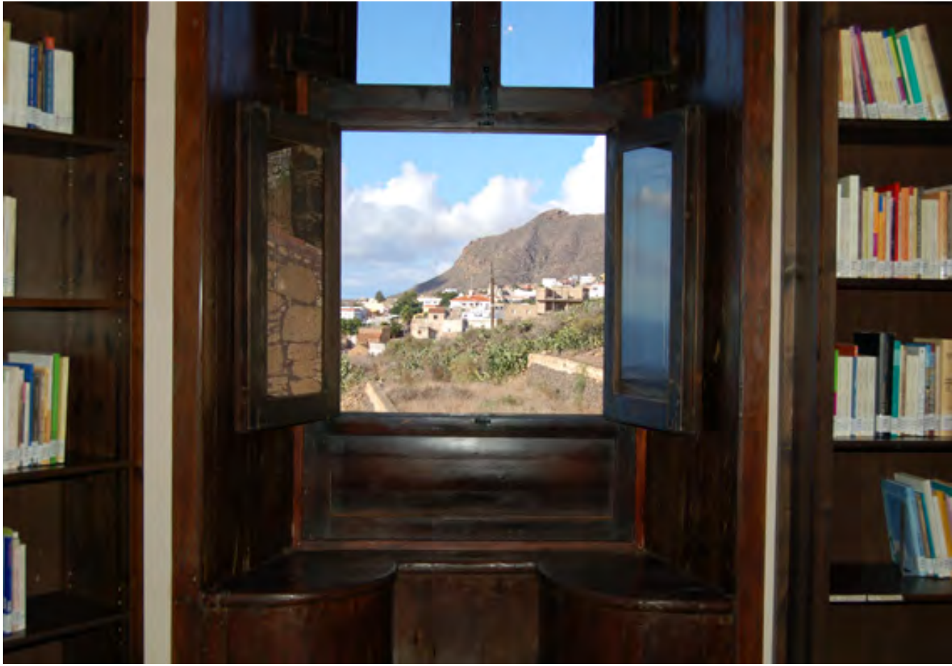
Escaño en la ventana. “Banco de novios”

M amá, que me voy a casar. Con esas palabras le llegó hoy su hija la más vieja. Y es que la muchacha ya era moza casadera y el muchacho, delgado y alto, como esos galanes de película, aquellas que ven los domingos cuando van al cine del pueblo, nunca solos, siempre con el cesto – como debe ser – el cesto a veces es su madre, a veces su tía o algunas veces las dos juntas... El cesto, sería, para los que no hayan vivido esas experiencias de antaño, las carabinas. Los novios llevaban hablando ya unos años, tres o cuatro, pero las cosas, ya que se hacían, había que “hacerlas bien”. Eran otros tiempos, la novia y el novio enamoraban de otra forma, diferente, muy pero que muy diferente a la de hoy. Existían los llamados bancos de novios , aquellos escaños que formaban parte de las ventanas, a modo de asiento. Antes, en aquellos tiempos en que no había más luz en el interior de las casas que la que daba la llama de una vela al oscurecer, las mujeres se sentaban en esos bancos al lado de las ventanas para aprovechar al máximo la luz del sol que entraba y coser hasta que ya la claridad se acababa y caía el peso de la noche.