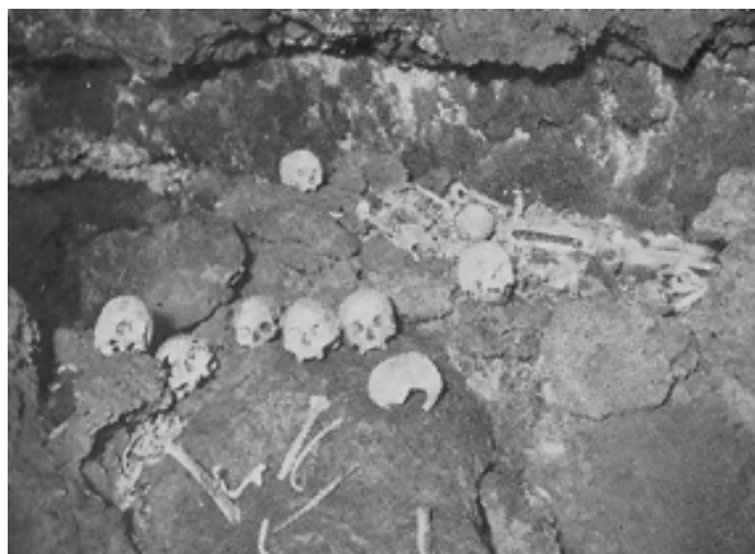
Necrópolis Cueva Uchova

D. Luís detalla la entrada de la cueva, en una obra de mampostería ejecutada para proteger el acceso al yacimiento hay un pequeño recuadro de cemento con la siguiente inscripción que transcribimos con sus fallos de ortografía " septiembre 14 año 1933. allado el día 19 de mayo del mismo año ". Esta descripción se conserva hoy en día tal cual la describe D. Luís en su trabajo, cuando visita la cueva-necrópolis 20 años después de su descubrimiento.